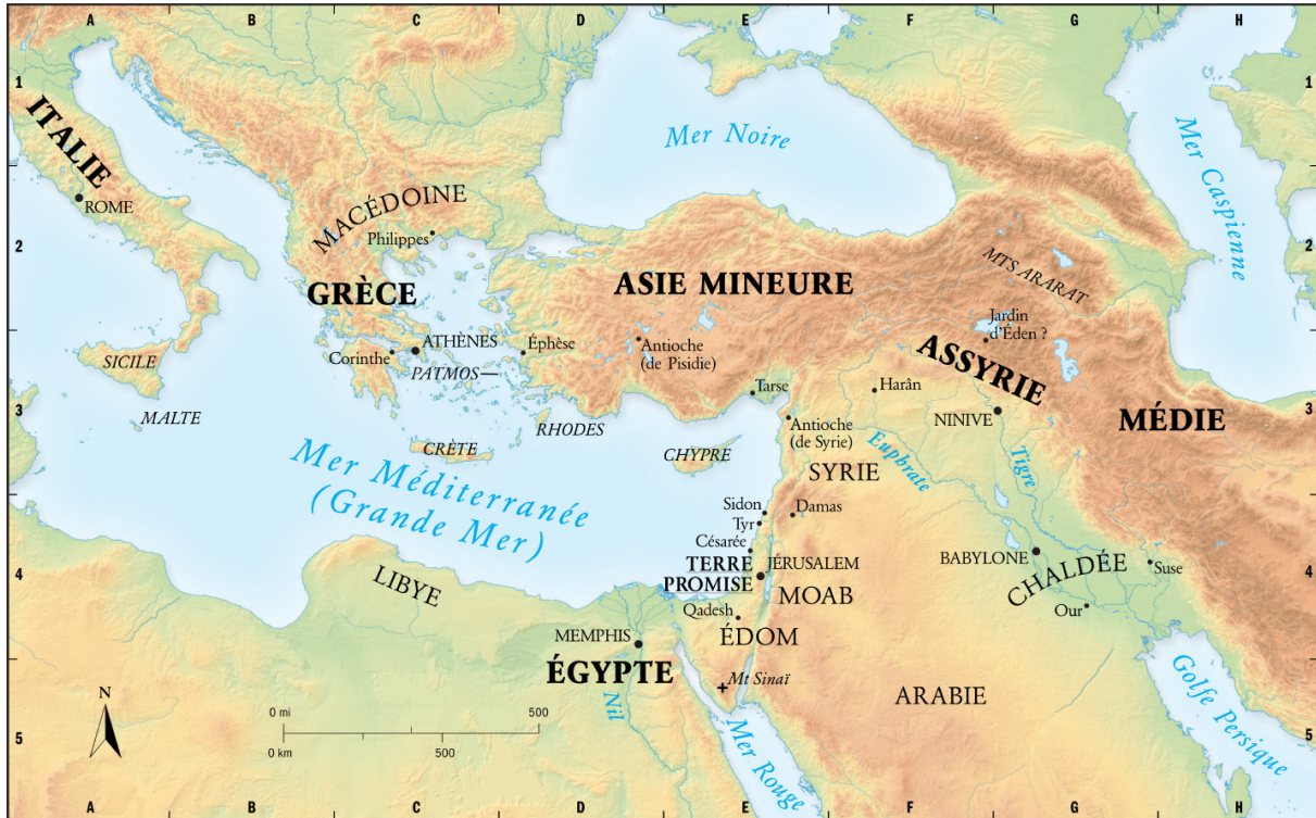
Carte des lieux où se sont déroulées les histoires de la Bible

déroulées se trouvent principalement en Asie (en Israël, en Égypte etc.) et dans des régions autour de la Méditerranée (en Grèce, en Italie etc.).